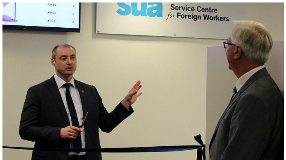
Bilde: Arbeids- og sosialministeren klippet snoren under åpningen av SUA i Bergen.

Husk å oppgi hvilket fylke du holder til i. For mer informasjon, sjekk skatteetaten.no/artikler-skatteinfo .